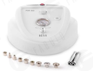
Obrázok 1: zariadenie AM60