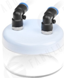
Obrázok 3: nádobka filtračného systému