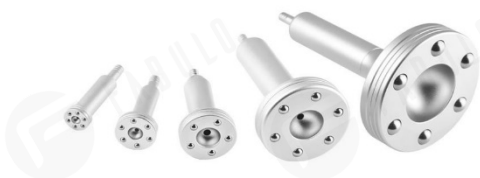
Obrázok 2: ošetrovacie hlavice