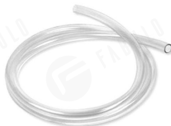
Obrázok 4: silikónová hadička