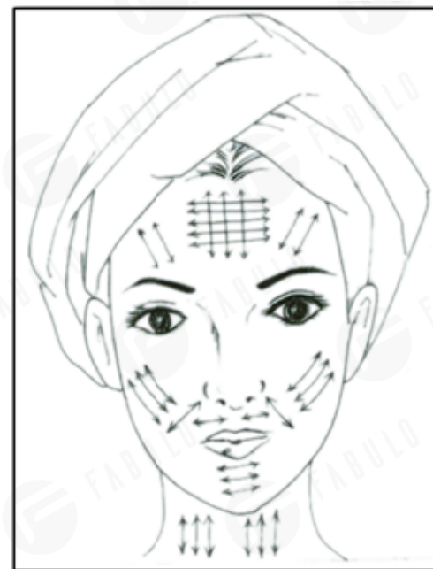
DIAGRAM NAVRHOVANÝCH POHYBOV A OBLASTÍ PRE DERMABRÁZU

8. Jemne natiahnite kožu palcom a prstom a 2 až 3-krát posuňte nadstavec po ošetrovanej oblasti. Potom znova prekrižte v rôznych smeroch, aby ste predišli pruhovaným čiaram ako na referenčnom obrázku. Ťahy štetcom alebo leštiace pohyby možno použiť na rôznych miestach.